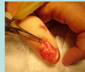
Visualização do leito tumoral após exérese do tumor.